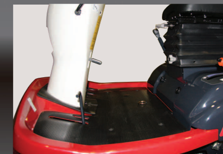
Groot bestuurdersplatform biedt veel voet- en beenruimte.