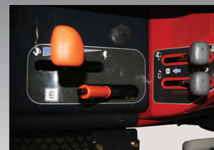
Standaard Cruise Control. 2 hendels voor heffen en openen van de grasopvangbak.