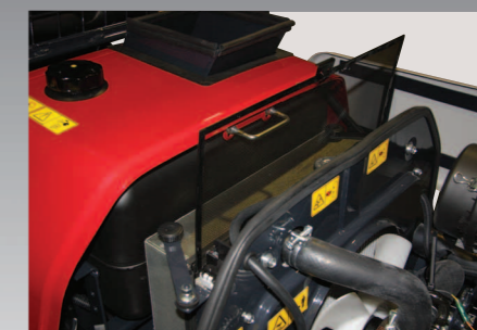
Makkelijk te reinigen zeef voor het stofvrij aanzuigen van koellucht.