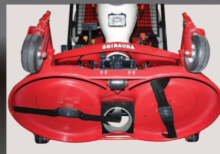
Uitstekende maaikwaliteit door aftakas aangedreven maaidek met 2 messen die tegen elkaar in draaien.