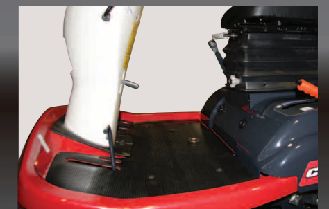
Groot bestuurdersplatform biedt veel voeten- en beenruimte.