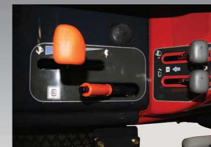
Standaard Cruise Control. Twee hendels voor heffen en openen van de grasopvangbak.