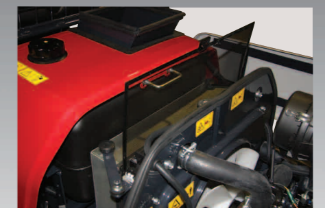
Makkelijk te reinigen zeef voor het stofvrij aanzuigen van koellucht.