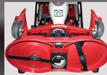
Uitstekende maaikwaliteit door aftakas aangedreven maaidek met 2 messen die tegen elkaar in draaien.